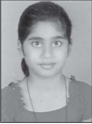
ರಿಯಾ ಸಾಂತುಮಯೋರ್ ದೊತೊನೆಂತ್ ಪಯ್ಲೆಂ ಬಾಪುಯ್: ದೆ ರಿಚಾರ್ಡ್ ಸಾಂತುಮಯೋರ್, ನೀರುಡೆ ಫಿರ್ಗಜ್