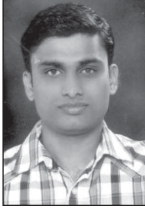
ಜಾಕ್ಸ್ನ್ ಡಿ'ಸೋಜ ಶಿಕ್ವಾಂತ್ ಪಯ್ಲೆಂ. ಆವಯ್ ಬಾಪುಯ್: ಜುಲಿಯಾನ ಆನಿ ಜೊಕಿಮ್ ವಾಮಂಜೂರ್ ಫಿರ್ಗಜ್.